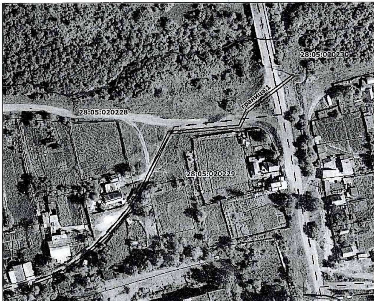
Схема расположения границ публичного сервитута на кадастровом плане территории кадастровых кварталов 28:05:020228; 28:05:020227; 28:05:020229; 28:05:020238