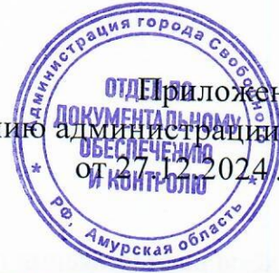
Схема границ публичного сервитута на кадастровом плане территории для строительства, реконструкции, эксплуатации, капитального ремонта объекта электросетевого хозяйства (ТП 10/0,4 кВ для электроснабжения строительства газовой котельной в квартале №180 г. Свободный)