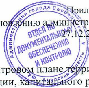
Схема границ публичного сервитута на кадастровом плане территории для строительства, реконструкции, эксплуатации, капитального ремонта объекта электросетевого хозяйства (ЛЭП 10 кВ для электроснабжения реконструкции очистных сооружений канализации район "Суражевка" г. Свободный)